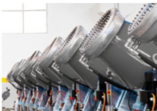
ABBATTIMENTO POLVERI E ODORI Linea Hidro jet