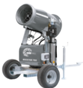
BOOSTER 700 TRAILER Linea Power jet