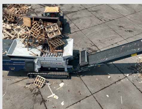
MACCHINARIO - URRACO 4000

A Cornate, in via De Amicis 50, si trova il centro di recupero: l'area di 20mila metri quadrati comprende un piazzale per la raccolta e il trattamento del legno, un capannone per lo stoccaggio e la lavorazione dei rifiuti speciali non pericolosi e una palazzina adibita a uffici. La realtà è munita anche di uno showroom (sempre nella città brianzola, in via Berlinguer, 25) interamente dedicato ai prodotti Lindner e di un magazzino, in cui lavorano 12 tecnici. Qualche mese fa la società ha inaugurato una sede a Monopoli per coprire le regioni del Sud come Basilicata, Calabria e Puglia e offrire consulenza tecnica ai clienti.