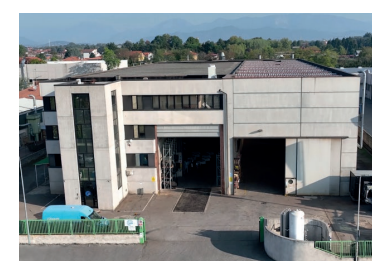
CENTRO STRATEGICO PER IL SERVICE CORNATE D'ADDA