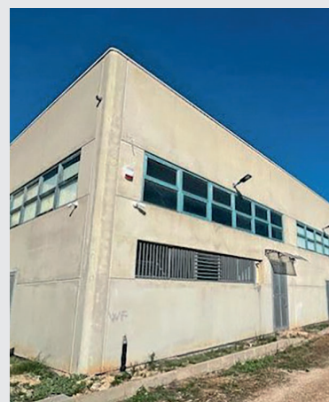
MONOPOLI CENTRO STRATEGICO PER IL SERVICE - MONOPOLI - BA -

A Cornate, in via De Amicis 50, si trova il centro di recupero: l'area di 20mila metri quadrati comprende un piazzale per la raccolta e il trattamento del legno, un capannone per lo stoccaggio e la lavorazione dei rifiuti speciali non pericolosi e una palazzina adibita a uffici. La realtà è munita anche di uno showroom (sempre nella città brianzola, in via Berlinguer, 25) interamente dedicato ai prodotti Lindner e di un magazzino, in cui lavorano 12 tecnici. Qualche mese fa la società ha inaugurato una sede a Monopoli per coprire le regioni del Sud come Basilicata, Calabria e Puglia e offrire consulenza tecnica ai clienti.