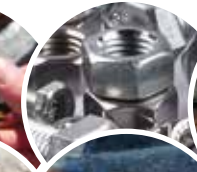
Bulloni e dadi